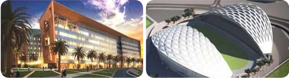
ضمن المشاريع التي استكملت في عهد المغفور له مشروع جامعة الشدادية - مدينة صباح الأحمد الجامعية بتصاميم مبانيه الجامعية المعمارية الفريدة

◀ مدينة الشدادية: تعد من المشاريع التي استكمل تنفيذها في فترة (2006-2020) حيث أنشأت بموجب المرسوم الأميري رقم 30 لسنة 2004 من مجلس الأمة الكويتي القاضي بتأسيس مدينة جامعية جديدة لجامعة الكويت بمدينة «الشدادية» خلال 10 سنوات وتم التعاقد مع أفضل الشركات العالمية لإنجاز المشروع بما يحمله كل مبنى منه من تصميم مبتكر وفريد يشكل منظرا عمرانيا مميذا لصروح تعليمية حديثة وفي سنة 2016 تسلمت جامعة الكويت أول مشروعات «-مدينة صباح السالم الجامعية».