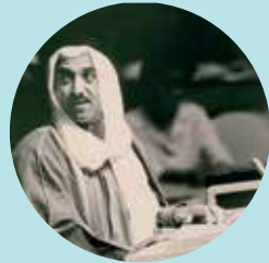
الشيخ صباح الأحمد ثاني وزير خارجية لدولة الكويت