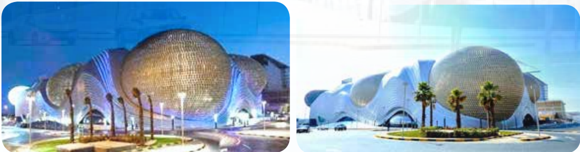
أفضل مركز تسوق لعام 2013 الاثنيوز- الذي افتتح في عهده سنة 2007 برعايته وحضوره

◀ مجمع الأثنيوز: افتتح عام 2007 يعد الصدارة بالمساحة وعدد الزوار في الكويت والمنطقة. تصاميمه مستوحاة من الأساليب الهندسية الحديثة والكلاسيكية. وقد أضفت تصاميمه صفة معمارية حديثة لمنطقة الري في مدينة الكويت وحصل على الجائزة الذهبية لأفضل مركز تسوق لعام 2013 في منطقة الشرق الأوسط وشمال أفريقيا.