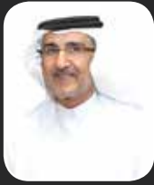
م. حمد مشروم

سريعاً بعد إنتكاسات كبيرة لم يكن بوسع العديد من الدول النهوض بها سريعاً وإعادة الإعمار بهذا الشكل المذهل وهذا يدل على العقلية الفذة الحكمة القادرة على تحقيق العديد من الإنجازات بقوة وثبات وحكمة ، مؤكداً أنه كان يرحمه الله أميراً للإنسانية مشهود له برقة قلبه ومساندته للجميع ، وهمه الأول هو ترابط الدول الخليجية والعربية مما جعله وسيطاً مقبولاً لدى كل الفرقاء ، فلم تفقده الكويت فحسب ورحيل مثل هذه القامة الكبيرة خسارة كبيرة على الصعيد الخليجي والعربي والإسلامي والعالم أجمع . وختم النصر رثائه بالقول: من النادر أن تحزن الأمة الخليجية والعربية والدولية على رحيل أمير أو رئيس دولة كما حزن الجميع على رحيل أمير الإنسانية مما يؤكد المحبة الصادقة من الجميع لهذا الإنسان المميز ، الله يرحمه ويغفر له ويسكنه فسيح جناته.