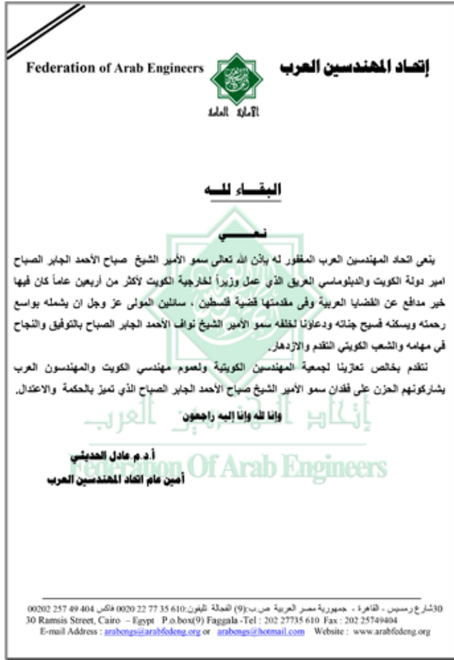
صورة ضوئية من نعوة المهندسين العرب للأمير الراحل

ماتحقق فعلاً...»، مضيفاً أن سمو يرحمه الله قد «سعى إلى حل المشاكل العالقة وتسوية الأمور الأخرى بين الأشقاء».