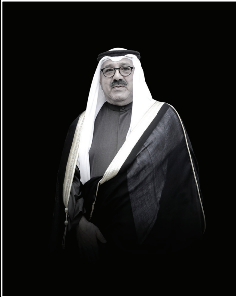
الشيخ ناصر صباح الأحمد الجابر الصباح يرحمه الله