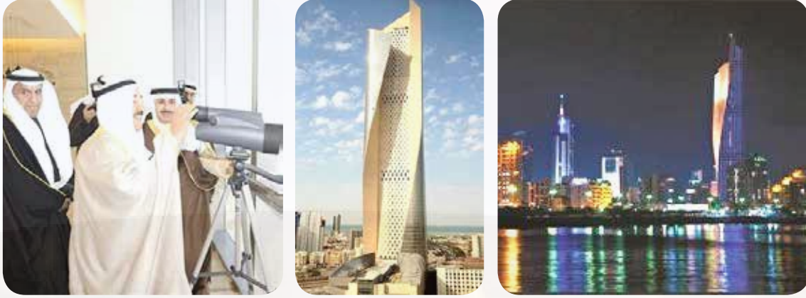
افتتاح أطول ناطحة سحاب في دولة الكويت - برج الحمراء- وبالمرتبة 23 على مستوى العالم بحضور المغفور له سنة 2012

◀ مجمع الحمراء: افتتح في عام 2012 يعتبر أطول ناطحة سحاب في الكويت وفي المرتبة 23 عالمياً؛ ومصمم بخلاف معظم ناطحات السحاب والتي ترتفع عمودياً باستقامة فإنه مصمم بحدارين من الجهة الجنوبية يمتد كل منهما بانحدار تدريجي عن الهيكل الأساسي للمبنى. وحاصل على جائزة أفضل تصميم معماري عام 2008.