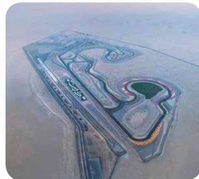
مدينة الكويت لرياضة المحركات - واحة إبداع الجمال العمراني والتي افتتحت برعاية وحضور المغفور له سنة 2018