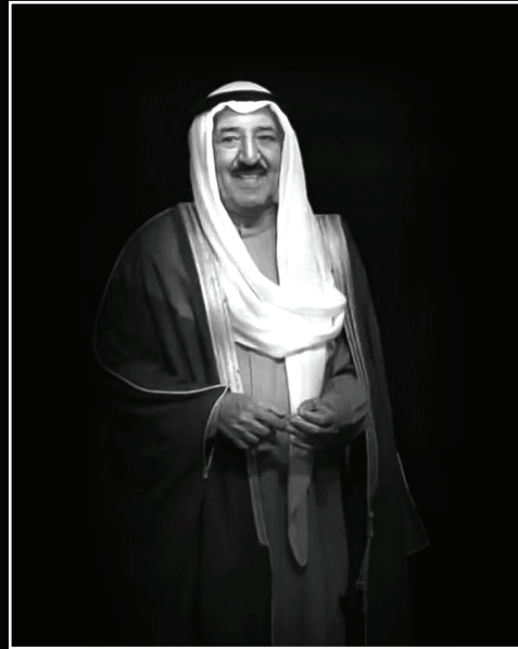
الشيخ صباح الأحمد الجابر الصباح يرحمه الله