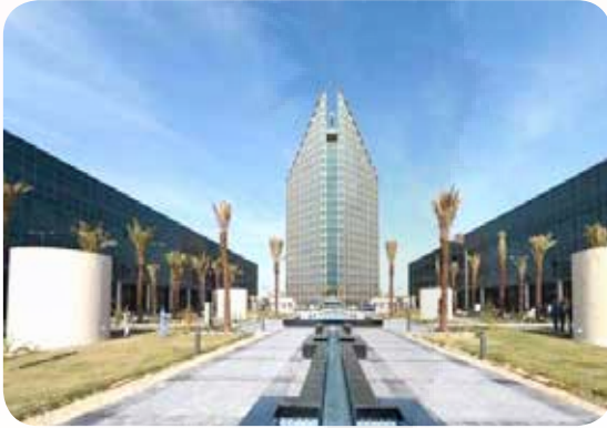
تصميم معماري مميز لمبنى التطبيقي الجديد الذي افتتح في سنة 2017