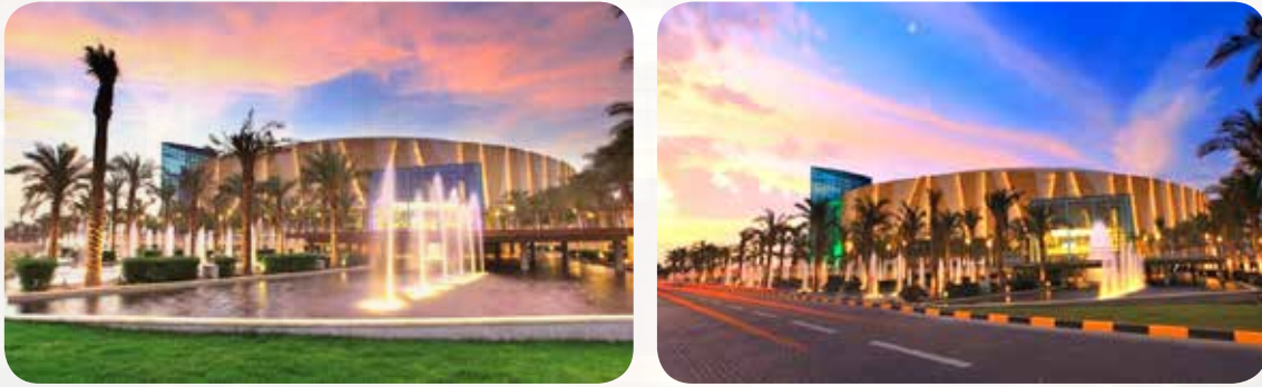
أفضل مركز تسوق في العالم لعام 2011 - مشروع 360- افتتح بحضور المغفور له

◀ مجمع 360: افتتح في سنة 2011 برعاية وحضور أميرى، وقد حصل على الجائزة الذهبية كأفضل تصميم مبتكر لمركز تسوق للعام ذاته من مجلس مراكز التسوق العالمي للشرق الأوسط وشمال أفريقيا؛ وله تصميم معماري حديث دائري الشكل استمد اسمه منه.