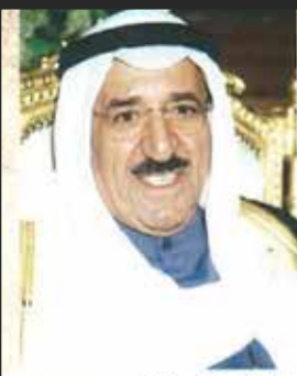
سمو رئيس مجلس الوزراء الشيخ / صباح الأحمد الجابر الصباح