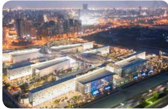
منارة علمية وحضارية مركز عبد الله السالم الذي افتتحه المغفور له سنة 2018