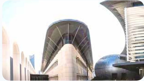
مبنى صباح الأحمد الجديد بمجلس الأمة- تحفة معمارية حديثة في صرح تاريخي شيد في عهده سنة 2016