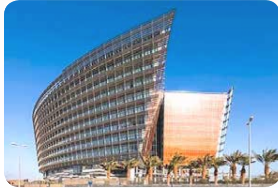
مبنى مقر وزارة التربية الجديد بتصميمه الفريد الذي حصل على جائزتين للمشاريع الثقافية والتراثية لسنة 2019