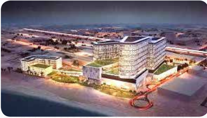
مستشفى الولادة الجديد سنة 2018