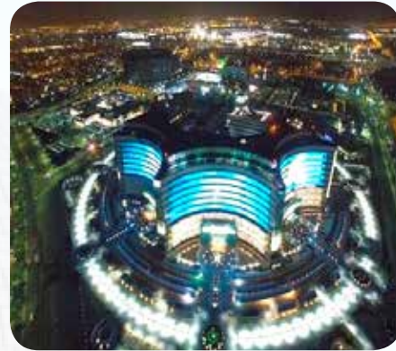
مستشفى جابر افتتح برعايته وحضوره سنة 2016

◀ مركز (سلوى صباح الأحمد الصباح) للخلايا الجذعية: تم افتتاحه عام 2019. ويعد الأول في منطقة الخليج.