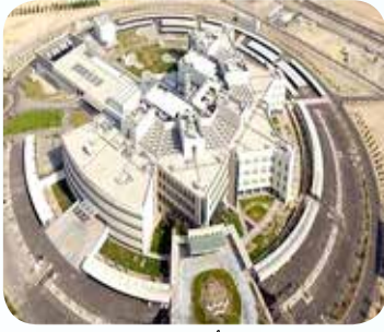
مستشفى الأحمدى الجديد افتتح بحضور المغفور له سنة 2017