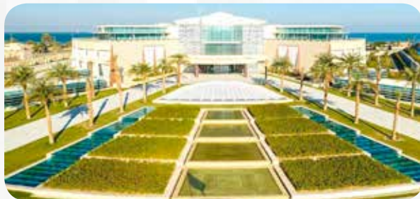
متحف قصر السلام-أحد أكبر المشاريع التي أعيد ترميمها وافتتاحها في عهده سنة 2019