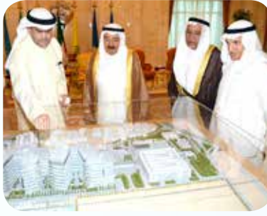
افتتاح مستشفى الجهراء في سنة 2018