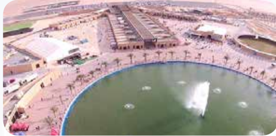
قرية -صباح الأحمد التراثية- تجمع عبق التاريخ وتراثه مع الحضارة العمرانية بمظهر بديع افتتحت بحضور ورعاية المغفور له سنة 2014