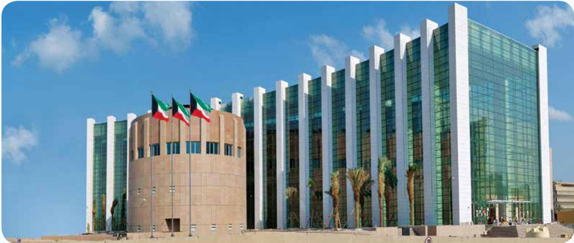
مبنى مكتبة الكويت الوطنية الجديد بحلة معمارية وهندسية مميزة سنة 2011

افتتح في 2011 و يقع بموقع مميز على شارع الخليج ويتألق بشكل معماري فريد ويعد من أكبر المكتبات محليا ودوليا والذي يعكس ازدهارا حضاريا وعمرانيا في جانب العلم والمعرفة. وقد حصل على التميز في جودة المشاريع من قبل المزود الرئيسي للمعلومات الاقتصادية لمنطقة الشرق الأوسط ( ميد) وذلك على مستوى دول مجلس التعاون الخليجي عبر حصوله على جائزة أفضل مشروع اجتماعي؛ وجائزة أفضل مشروع ترفيهي وسياحي.