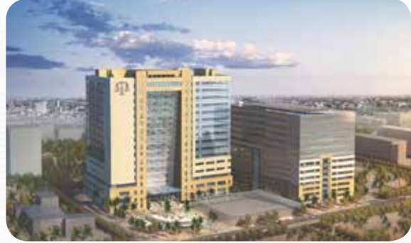
مجتمعا محاكم الجهراء والفروانية - أحد المشاريع التنموية والخدماتية بإبداع عصري يواكب الحضارات الانسانية المتقدمة عالميا افتتح بحضور ورعاية المغفور له سنة 2016

◀ مبنى معهد الكويت للدراسات القضائية والقانونية. أنجز في سنة 2013 وينفرد بشكل معماري مميز بمنطقة القبلة بمدينة الكويت كما يتميز بوجود مهبط «للهليوكوبتر» ضمنه بالإضافة إلى احتوائه القاعات المتعددة المناسبة مع غايات إنشائه المتطورة.