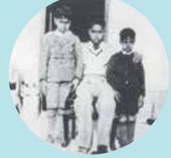
الأخوان صباح وجابر الأحمد في مدرسة المباركية