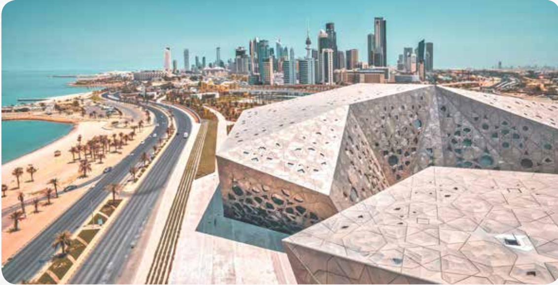
الإبداع العمراني في أكبر مركز ثقافي والذي افتتح في سنة 2016

تم انجازه 2016، وحصد جائزة عالمية في مجال الهندسة المعمارية والهندسة الداخلية 2017، فاز بجائزة أفضل مشروع هندسي معماري وأفضل هندسة داخلية في المنطقة العربية والإفريقية عن فئة المباني العامة والمقدمة من مؤسسة (انترناشيونال بروبيرتي اواردز) (international property awards) العالمية. وتميزت الكويت خلال هذه الفترة أيضا بإنجازها عدة منشآت ثقافية اشتهرت بتميزها المعماري منها مركز الشيخ عبد الله السالم الثقافي والذي تم انجازه عام 2018.