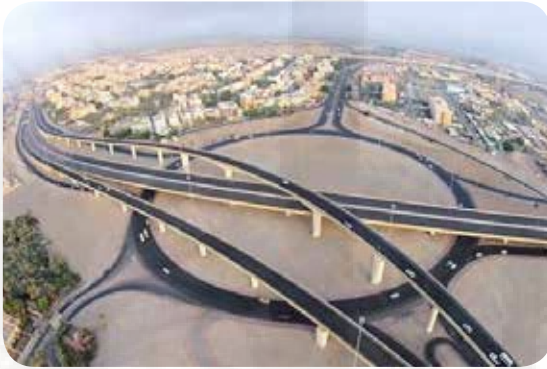
مشاريع طرق عديدة بتصاميم عمرانية مميزة منها «طريق الجهراء» 2016 رسمت خريطة عمرانية حديثة للكويت