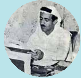
الشيخ صباح الأحمد أول وزير إعلام لدولة الكويت