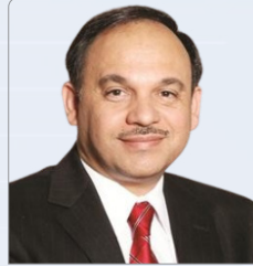
المهندس هاشم الرفاعي مستشار دولة الكويت