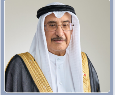
بحضور معالي الشيخ خالد بن عبد الله آل خليفة نائب رئيس مجلس الوزراء